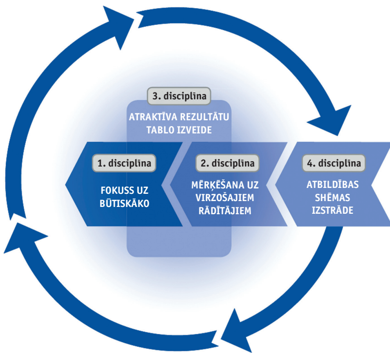
4 izpildes disciplīnas – process

Neraugoties uz to, ka šobrīd cilvēkiem ir pieejamas augsti attīstītas tehnoloģijas un plašāka izvēles brīvība, tikai daži spēj saglabāt uzmanības centrā svarīgākās prioritātes un nodrošināt to izpildi.